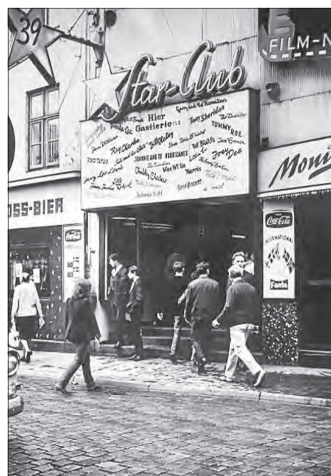
Den berømte Star Club i Hamburg, hvor The Beatles spillede for sidste gang i Hamburg, nytårsaften 1962.

Cover til John Lennons album "Rock'n'Roll" (1975). Billedet er taget i Hamburg i en baggård, og Lennon spurgte fotografen: - Hvordan skal jeg se ud? - Arrogant, som du plejer, lød svaret.