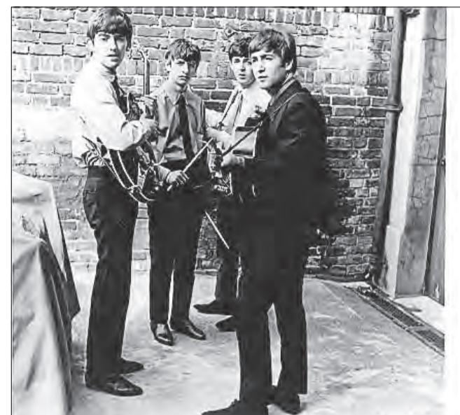
The Beatles fanget uden for Abbey Road Studiet, 1. juli 1963, lige før de skal indfor og indspille "She Loves You". Deres tredje hit-single.